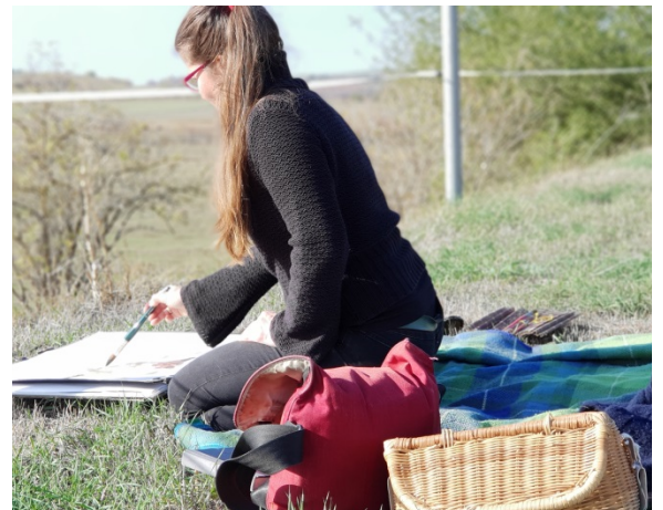
Durchführung eines Pleinairs im Rahmen des Lutherwegtages