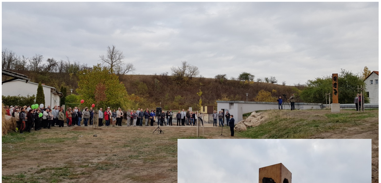
Enthüllung der Holzstehle zum Abschluss des Lutherwegtages in Wansleben am See