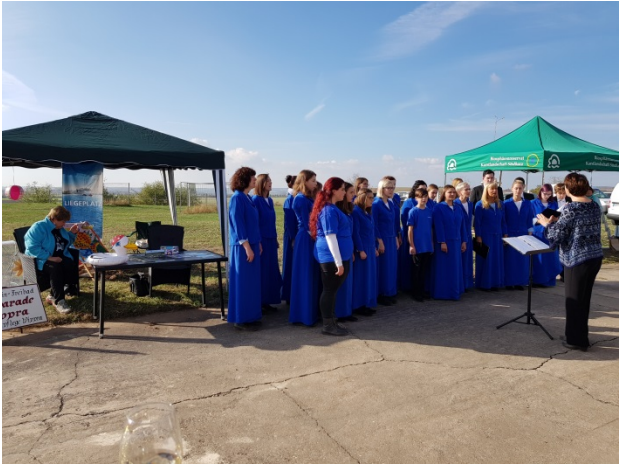
Wetterbedingte spontane Verlagerung der Darbietungen des Männerchores Erdeborn und des Kinder- und Jugendchores der Lutherstadt Eisleben ins Freie