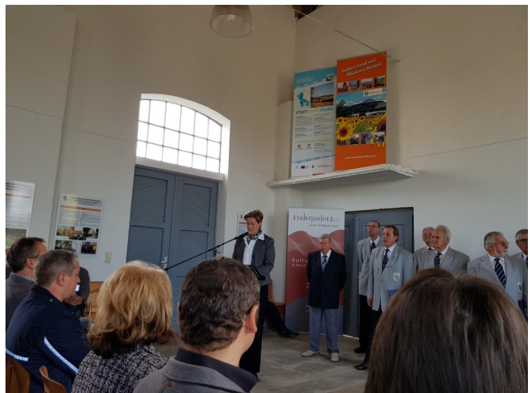
Grußwort stell. Landrätin des LK Mansfeld-Südharz