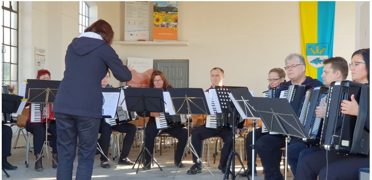
Auftritte des Akkordeonorchesters „Im tacct“ der Kreismusikschule Mansfeld-Südharz