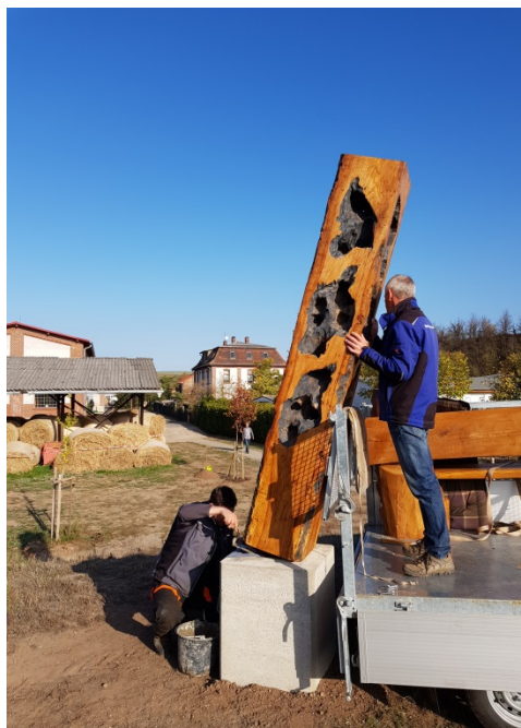
Anlieferung der Holzkunstwerke