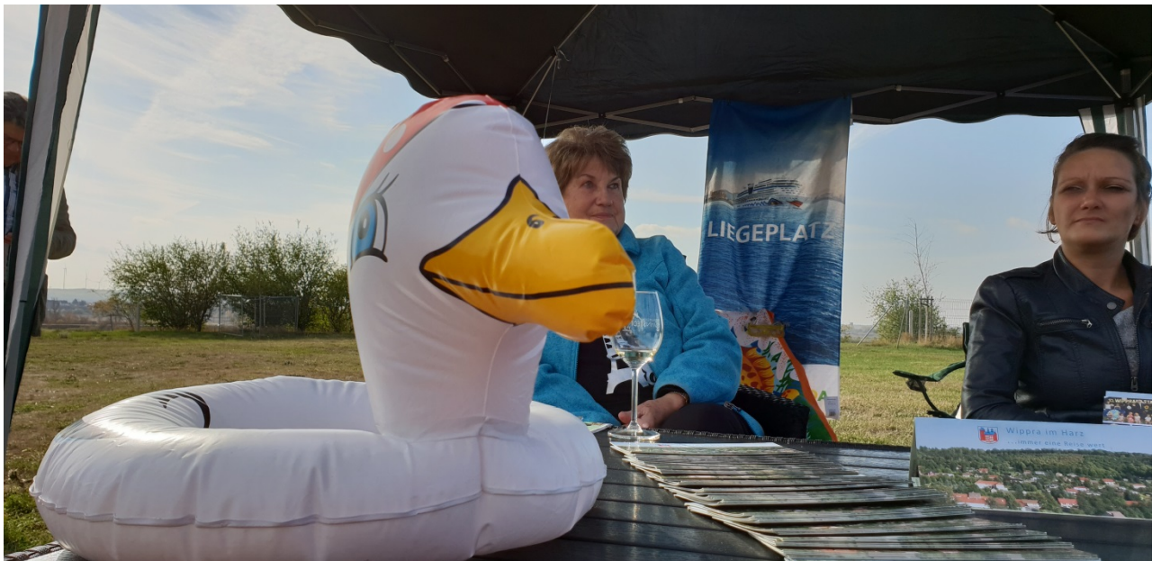
Kräftige Werbung schon für den nächsten Lutherwegtag im Mai 2019 durch die Projektpartner aus Wippra und einen Informationsfilm der LAG Mansfeld-Südharz