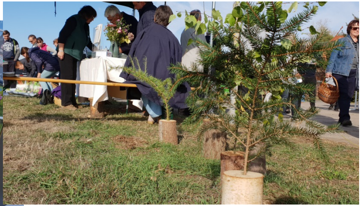
Informationsstand des Biosphärenreservates Karstlandschaft Südharz