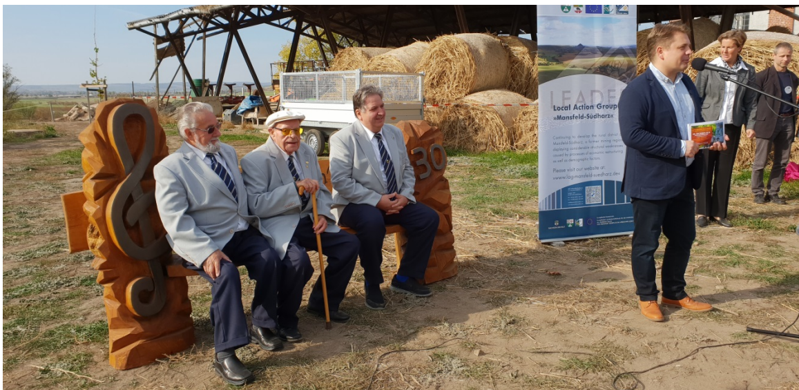
„Probesitzen“ der ältesten Sänger und des jüngsten Chormitgliedes