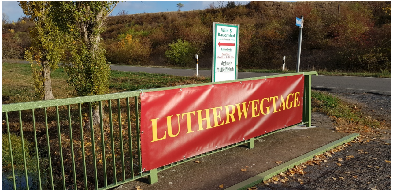
Werbung für das Kooperationsprojekt an der Zufahrtsstraße zur Gedenkstätte