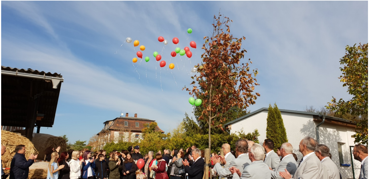
erste Luftballons steigen in den Herbsthimmel auf