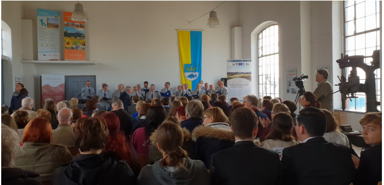
Eröffnung der Veranstaltung mit dem Männerchor Erdeborn