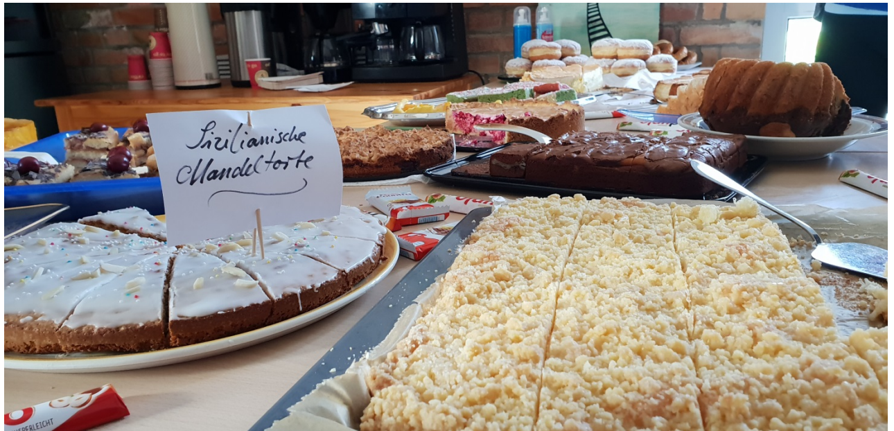
Die Versorgung mit süßen- und kräftigen Speisen war sichergestellt