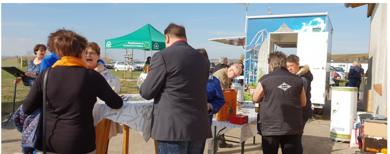
Gut besuchter Weinstand des Projektpartners Hönstedt aus dem Saalekreis