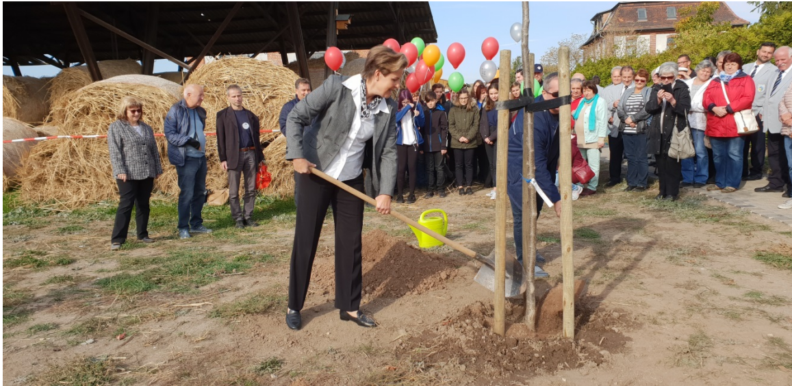
Baumpflanzung durch Vertreter*innen der beiden Landkreise MSH und SK